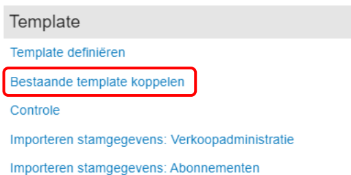
Figuur 2 Kies voor "Bestaande template koppelen"