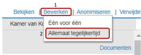
Figuur 4 Klik op 1 "Bewerken" 2 "Allemaal tegelijkertijd"